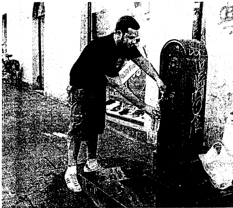
NEL MIRINO Anche la fontana di piazza Napoleone è stata danneggiata