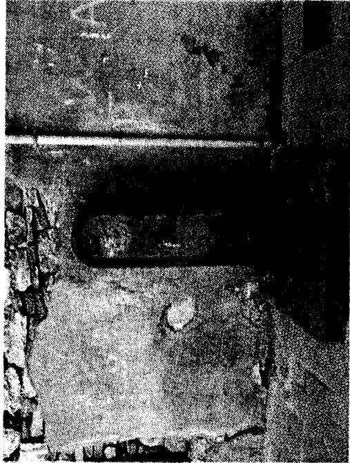
La fontana di via del Bastardo

Oltre alla normale opera di controllo e vigilanza svolta dai tecnici della Geal, l'azienda ricorda che il servizio gratuito di segnalazione guasti (numero verde 800 282172) è attivo 24 ore su 24 e può essere attivato anche per quello che riguarda le fontane pubbliche del territorio.